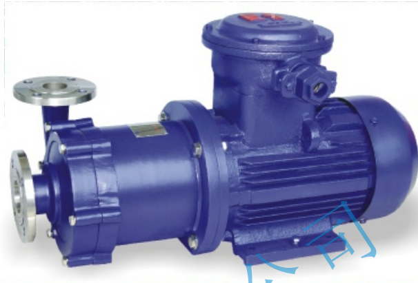
CQ不锈钢磁力驱动泵

磁力泵结构紧凑、外形美观、体积小、噪音低、运行可靠、使用维修方便。可广泛应用于化工、制药、石油、电镀、食品、科研机构、国防工业等单位抽送酸、碱液、油类、稀有贵重液、毒液、挥发性液体，以及循环水设备配套、过滤机配套。特别是易漏、易燃、易爆液体的抽送，选用此泵则更为理想。